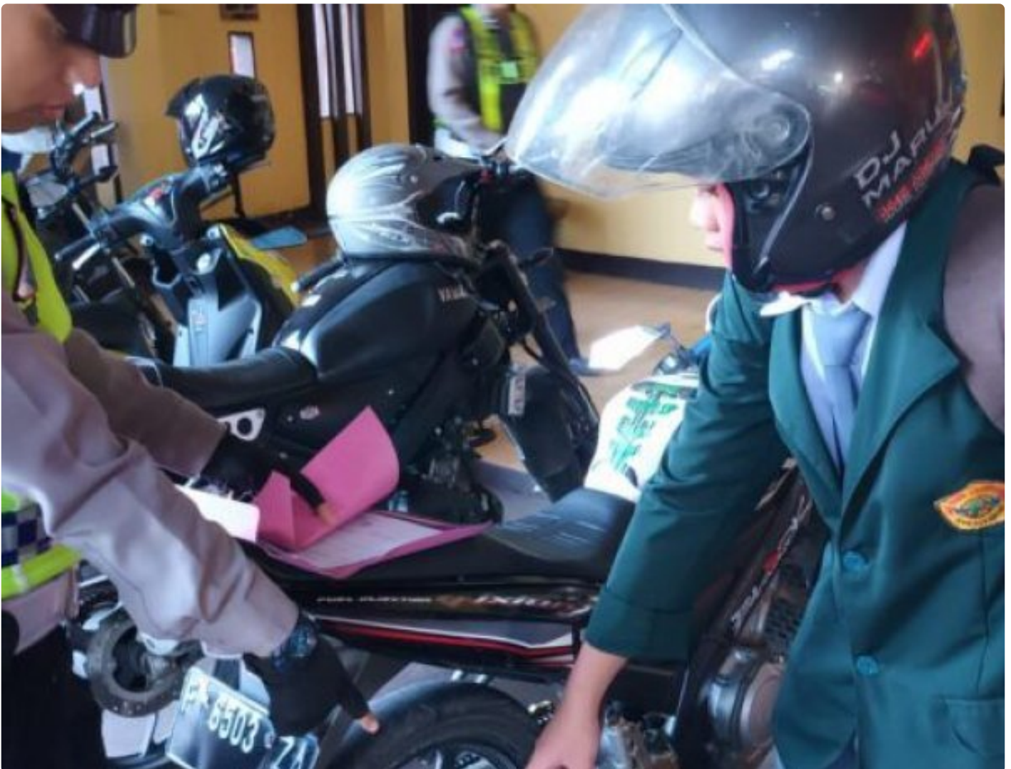
Polsek Cisaat Polres Sukabumi Kota

Kota Sukabumi – Polres Sukabumi Kota Polda Jawa Barat – Unit Lalulintas Polsek Cisaat Polres Sukabumi Kota setiap hari, melaksanakan sosialisasi dan penertiban knalpot brong atau knalpot tidak sesuai dengan spesifikasi Hal ini untuk mencegah penggunaan knalpot brong dikalangan pelajar, Selasa